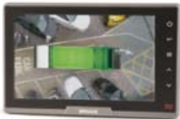
Immagine reale prodotta da Backeye®360

Backeye®360 elimina il problema degli angoli ciechi, un potenziale pericolo per qualsiasi oggetto o persona che si trovi sulla traiettoria di un veicolo in movimento. Le immagini digitali provenienti da quattro telecamere ultragrandangolari vengono combinate per offrire una vista "a volo d'uccello" del veicolo e del suo tempo reale una singola immagine sul monitor del guidatore: la soluzione ideale per prevenire gli incidenti, risparmiare denaro e salvare vite umane.